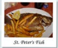
St. Peter's Fish