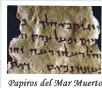
Papiros del Mar Muerto

Ha llegado el momento de explorar la nueva Jerusalén. Visitaremos el Museo del Holocausto, el Museo Israel (donde se exhiben los papiros del Mar Muerto) y el Segundo Templo Modelo de la ciudad de Jerusalén.