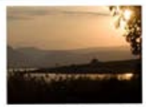
Puesta de sol en Galilea