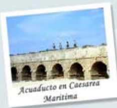
Acueducto en Caesarea Marítima

* Si por alguna razón inesperada y poco probable los hoteles indicados en el itinerario no están disponibles, se sustituirán con otros hoteles de 3 estrellas.