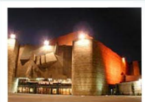
Teatro de Jerusalem

Luego regresaremos a nuestro hotel en Jerusalén a cenar y a descansar.