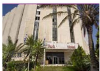
Hotel Park en Jerusalem