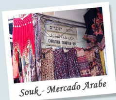
Souk - Mercado Árabe

Luego nuestro paseo guiado nos llevará a recorrer los angostos callejones del souk o mercado árabe y el Camino de la Cruz, hasta la Iglesia del Santo Sepulcro.