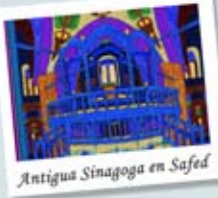
Antigua Sinagoga en Safed

Pasaremos la noche en el Hotel Deborah*, donde todas las habitaciones tienen vista al mar. http://www.deborah-hotel.co.il/