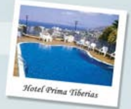
Hotel Prima Tiberias